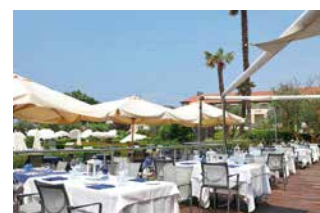
Das 4-Sterne Hotel Caesius Therme & Spa mit großzügigem Wellnessbereich liegt im malerischen Ort Bardolino am Gardasee.